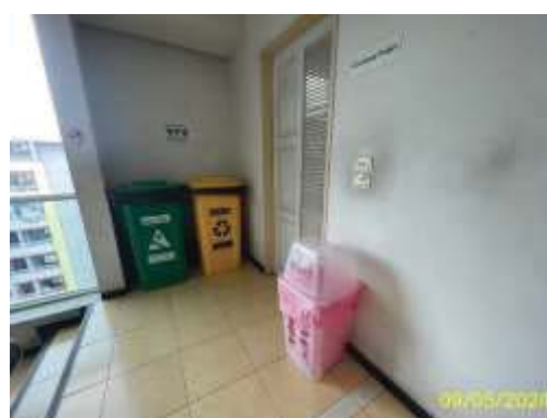
ถังรองรับมูลฝอยติดเชื้อประจำชั้น