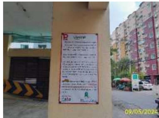
ป้ายเกี่ยวกับระเบียบการใช้พื้นที่จอดรถ