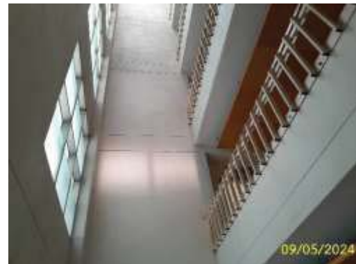
ภาพที่ 1.3.10-1 (ต่อ) ไฟฟ้าและการสื่อสาร