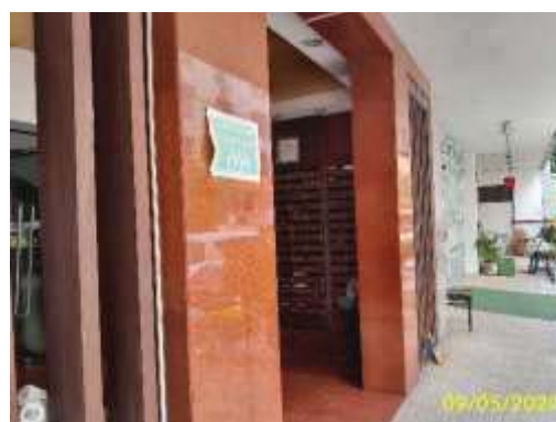
จุดรวมพล