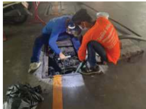
ภาพที่ 1.3.4-1 การบำบัดน้ำเสียและสิ่งปฏิกูล