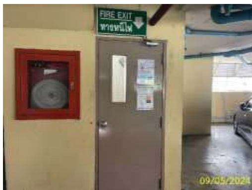
ตู้เก็บสายฉีดน้ำดับเพลิง