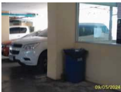
ถังรองรับมูลฝอยพื้นที่ส่วนกลาง