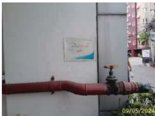
หัวรับน้ำดับเพลิง