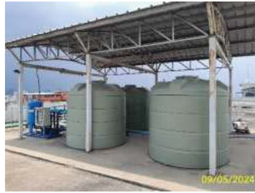
ปั๊มและถังเก็บน้ำใช้ชั้นดาดฟ้า