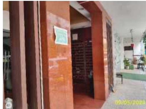
ภาพที่ 1.2-2 สภาพปัจจุบัน