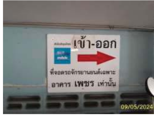
ป้ายและสัญลักษณ์ทางด้านจราจร