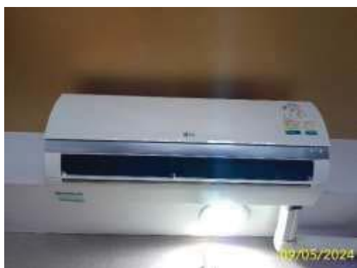
อุปกรณ์ไฟฟ้าชนิดประหยัดพลังงาน