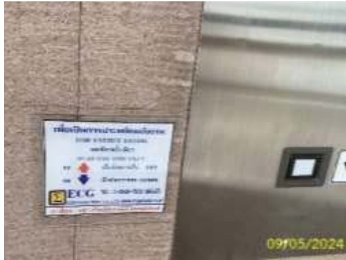
การรณรงค์เกี่ยวกับการประหยัดพลังงาน