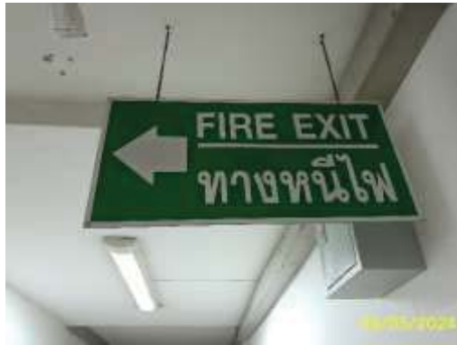
ป้ายแสดงเส้นทางหนีไฟ