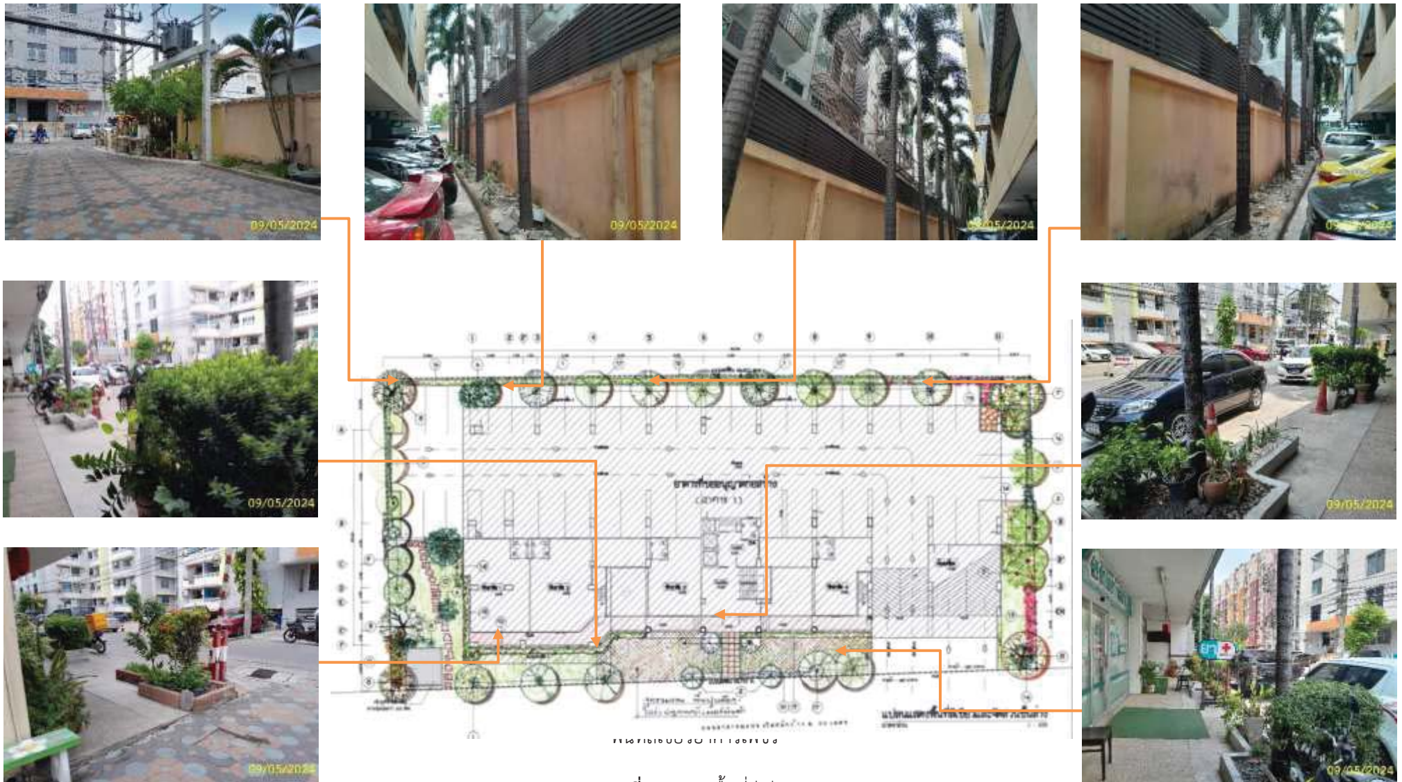
ภาพที่ 1.3.2-1 พื้นที่สีเขียว