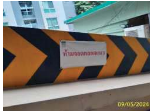
ภาพที่ 1.3.8-1 การจราจร