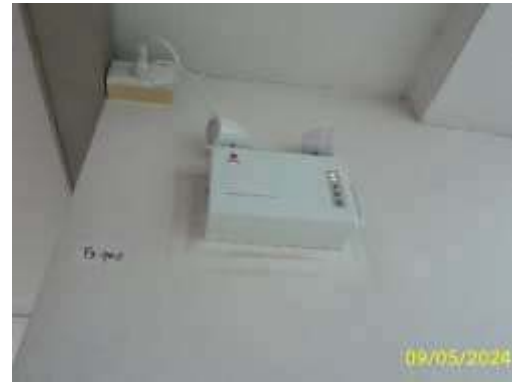
ไฟส่องสว่างฉุกเฉิน