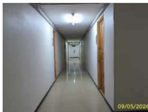
ภาพที่ 1.3.10-1 ไฟฟ้าและการสื่อสาร