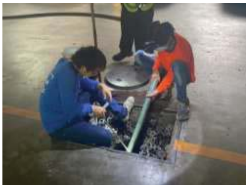
การสูบน้ำส่วนเกินระบบบำบัดน้ำเสีย