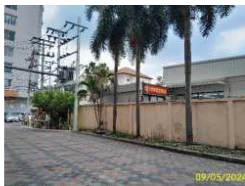
จุดจอดรถเก็บขนมูลฝอย