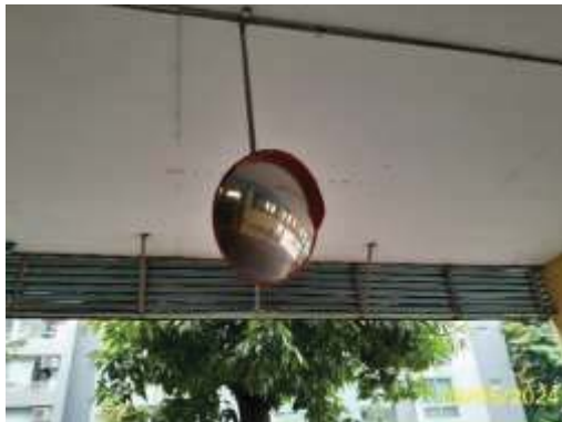
ป้ายและสัญลักษณ์ทางด้านจราจร