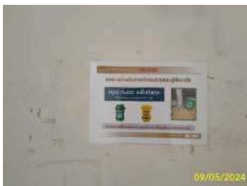
ป้ายเกี่ยวกับการทิ้งมูลฝอย