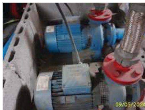
ภาพที่ 1.3.3-1 น้ำใช้