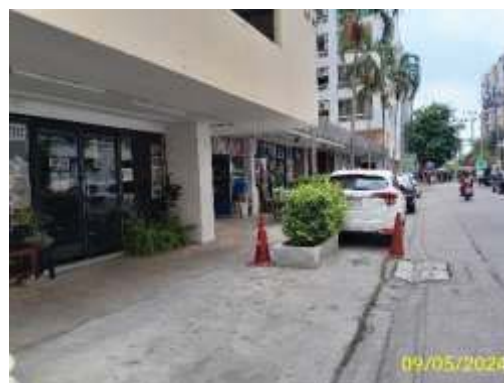
ภาพที่ 1.3.1-1 โครงสร้างอาคารเพชร