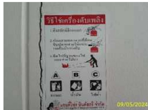
ป้ายแนะนำการใช้อุปกรณ์