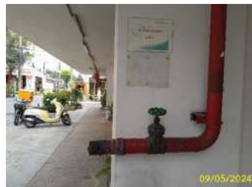
ภาพที่ 1.3.9-1 (ต่อ) การป้องกันอัคคีภัย