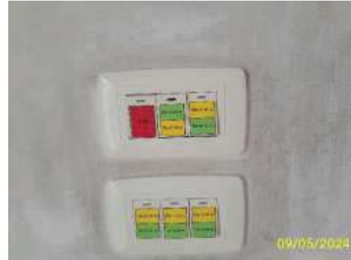
การกำหนดเวลาและสวิตช์แยกเฉพาะจุด