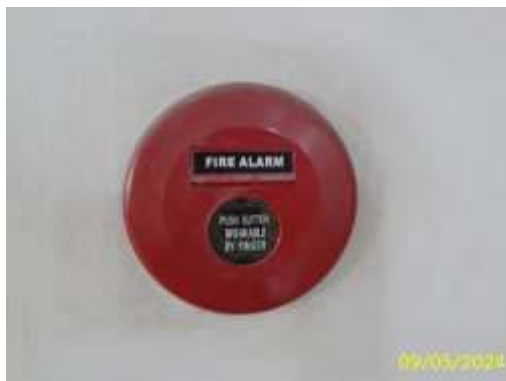
อุปกรณ์แจ้งเตือนเพลิงไหม้