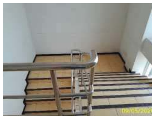
บันไดหนีไฟ